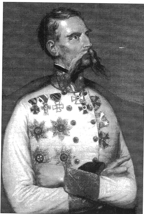
JULIUS JAKOB FREIHERR VON HAYNAU

A FÉRFI LEGYEN SZILÁRD, MINT A KŐ, HŰSÉGE PEDIG EGYENES, MINT A NYÍL